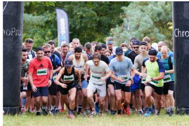
TRAIL - 7ème édition de la FUMANA - Départ 10 km - Photo Hugo Drelon

L'Est Républicain - 08 sept. 2024 à 14:00 | mis à jour le 08 sept. 2024 à 14:12 - Temps de lecture : 1 min