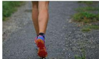
La « Fumana » est une des dix plantes protégées sur le plateau de Malzéville, agréé « Natura 2000 » et « Espace naturel sensible ».

Samedi 9 à 20 h 30 et dimanche 10 septembre à partir de 8 h 30. Renseignements, horaires et inscription sur fumana.fr