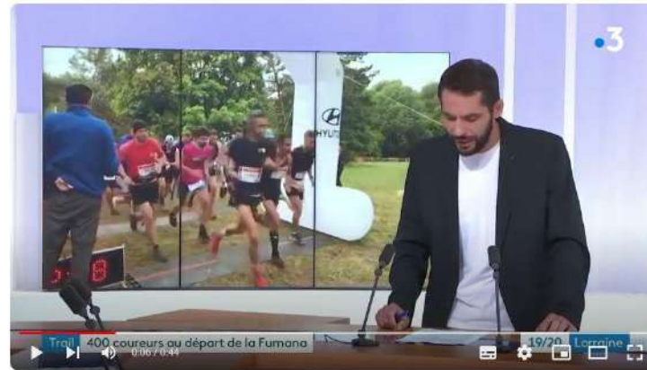
Trail: cinquième édition de la Fumana