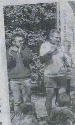
Dix bénévoles organisateurs

La fumana est une petite plante herbacée à fleurs jaunes qui affectionne les sols secs et calcaires.