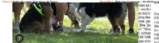
Malzévillais - Bienvenue tous les week-ends !

La Fumana, c'est un peu un aboi de bonne nuit pour malzévillais à venir s'endormir sous les étoiles, un trail nocturne de 10 km. Et le lendemain, un semi-marathon pour les plus courageux sous une pluie de 21,3 km qui promet d'être un véritable défi avec un dénivelé positif conséquent de 900 mètres, un trail nocturne de 10 km pour repérer le grand air, et bien sûr, une course pour les enfants, parce que la famille passe au premier à la fête. La Fumana, c'est une ambiance 100% conviviale où les soirées sont gratuites et où tous les participants repartent avec un petit cadeau ! Mais c'est aussi le café, pour évaluer les besoins, des boissons à la main pour échauffer le matin et des fruits secs pour récupérer l'effort. Le président David Bigeard et toute son équipe de bénévoles assurent : « notre terrain favori, chemin sinueux et sans imperméabilisé, sans compter avec les deux routes qui s'y croisent parfois. Les travaux sont en cours. Et d'ailleurs, trois bonnes raisons de participer : « Du trail nocturne à la course d'endurance, chacun peut trouver son compte, donc participez ! De plus, l'endurance de votre organisme, avec des soirées et des encouragements à tous les côtes de chemin, ça change des soirées à l'arrêt ! Enfin, c'est sur le plateau, un espace où il y a tout plein de petits cadeaux. Pour compléter la gamme des soirées : Samedi 10 septembre à 20 h 30 et dimanche 11 septembre à partir de 8 h 30. Renseignements, horaires et inscription sur fumana.fr