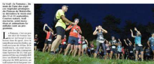
Un trail nocturne de 10 km est prévu le samedi soir.

La Fumana, c'est un peu un aboi de bonne nuit pour malzévillais à venir s'endormir sous les étoiles, un trail nocturne de 10 km. Et le lendemain, un semi-marathon pour les plus courageux sous une pluie de 21,3 km qui promet d'être un véritable défi avec un dénivelé positif conséquent de 900 mètres, un trail nocturne de 10 km pour repérer le grand air, et bien sûr, une course pour les enfants, parce que la famille passe au premier à la fête. La Fumana, c'est une ambiance 100% conviviale où les soirées sont gratuites et où tous les participants repartent avec un petit cadeau ! Mais c'est aussi le café, pour évaluer les besoins, des boissons à la main pour échauffer le matin et des fruits secs pour récupérer l'effort. Le président David Bigeard et toute son équipe de bénévoles assurent : « notre terrain favori, chemin sinueux et sans imperméabilisé, sans compter avec les deux routes qui s'y croisent parfois. Les travaux sont en cours. Et d'ailleurs, trois bonnes raisons de participer : « Du trail nocturne à la course d'endurance, chacun peut trouver son compte, donc participez ! De plus, l'endurance de votre organisme, avec des soirées et des encouragements à tous les côtes de chemin, ça change des soirées à l'arrêt ! Enfin, c'est sur le plateau, un espace où il y a tout plein de petits cadeaux. Pour compléter la gamme des soirées : Samedi 10 septembre à 20 h 30 et dimanche 11 septembre à partir de 8 h 30. Renseignements, horaires et inscription sur fumana.fr